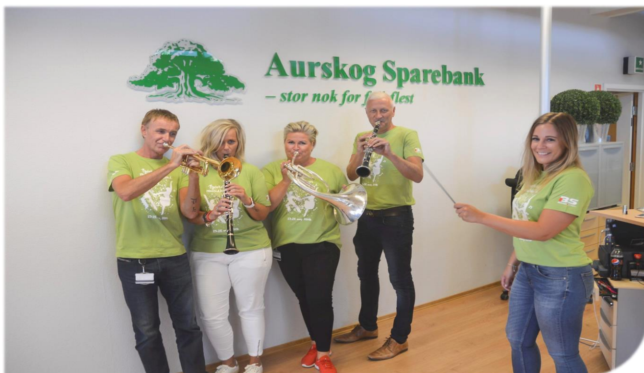
Aurskog Sparebank er hovedsponsor for Bjørkelangen Musikkfestival