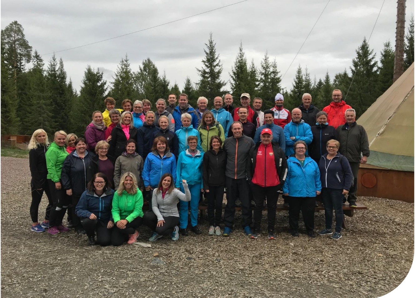
Et flertall av de ansatte i Aurskog Sparebank