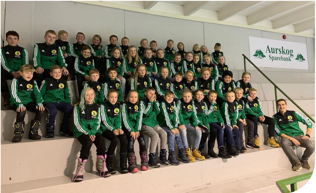
Bilde fra åpningen av Aurskog Sparebank fotballakademi i AFSK som ble åpnet i januar 2019. Prosjektet mottok en gave fra banken på kr 300.000,- til oppstarten.