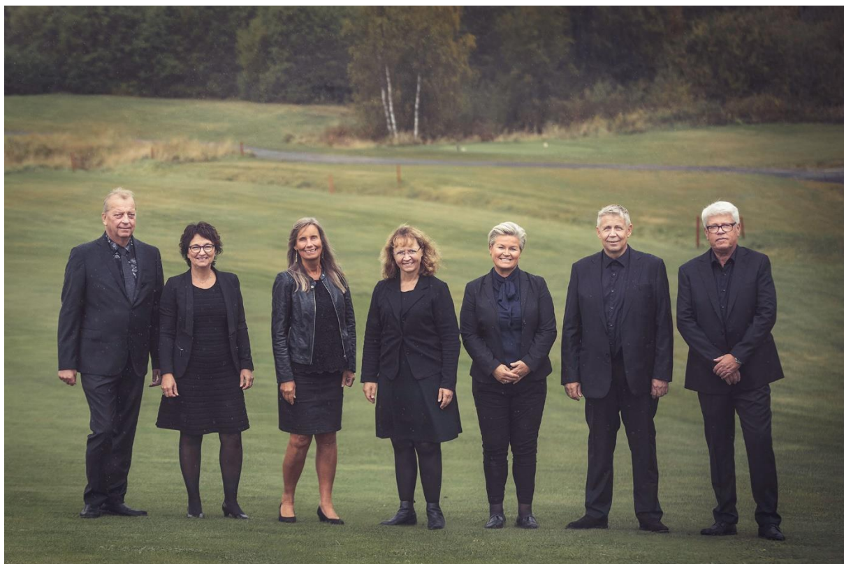
Styret i Aurskog Sparebank

*Av totale nedskrivninger er 0,7 mill bokført på utlån til kredittinstitusjoner, 46,8 mill bokført på kundeutlån og 1,2 mill på poster utenfor balansen under avsetninger.