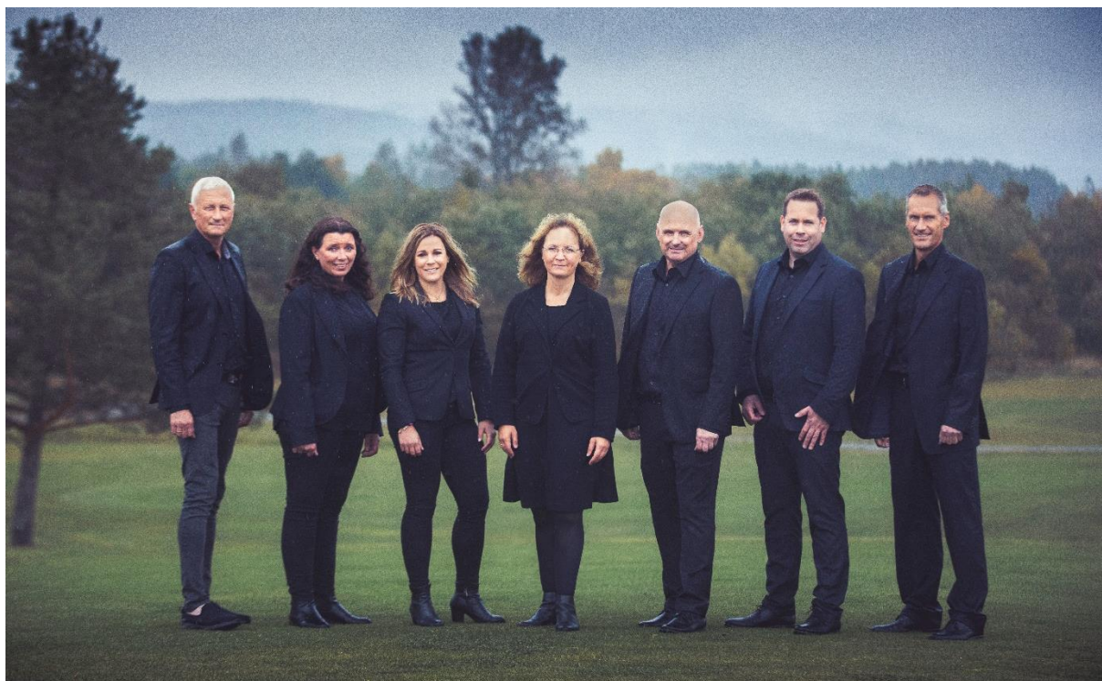
Ledergruppen i Aurskog Sparebank

*Av totale nedskrivninger er 0,8 mill bokført på utlån til kredittinstitusjoner, 46,3 mill bokført på kundeutlån og 2,6 mill på poster utenfor balansen under avsetninger.